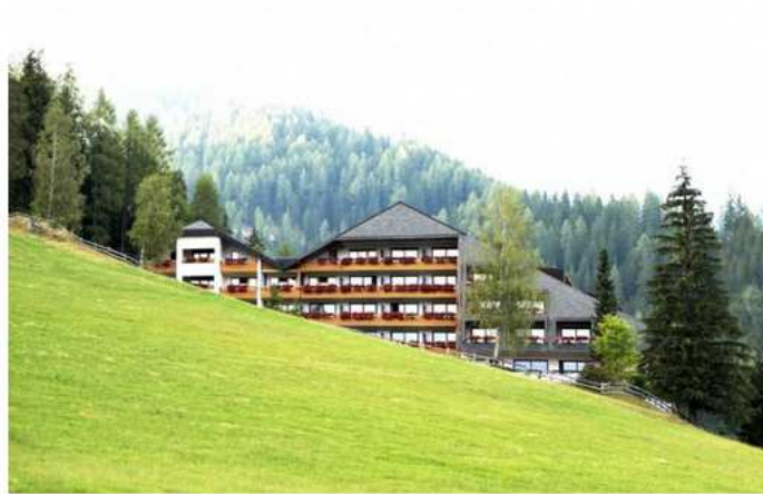
Das 100-Betten Haus liegt am Fuße der Nockberge.

Am Anfang durften 30 Ortseinwohner selbst das Hotel beziehen und sich einen Eindruck machen. Jetzt sind alle anderen dran. Das gesamte Programm www.hotelkonkurrenz.at zu finden. Zimmer kosten 125€ pro Person , Kinder unter 12 sind gratis und inkludiert sind neben der Übernachtung mit Frühstück, Mittagessen und Abendessen auch alle Veranstaltungen. Eine Nacht in einer der zu Mehrbettzimmern umfunktionierten Suiten (mit eigener Sauna) kostet 55€ (ebenfalls Vollpension).